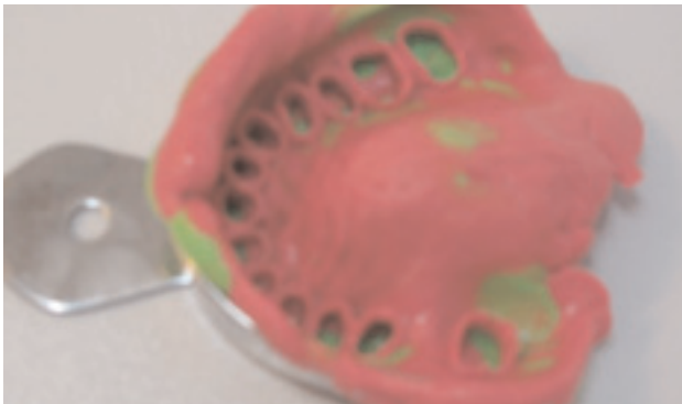
Abb. 2 Korrekturabdruck mit Detaseal® hydroflow putty und Detaseal® hydroflow lite

Eine andere Möglichkeit Detaseal® hydroflow putty in Verbindung mit Detaseal® hydroflow lite/-Xlite zu verwenden, wäre die Doppelmischabformung. Da die Verarbeitungszeit 1 Min. 30 Sek. bzw. 2 Min.